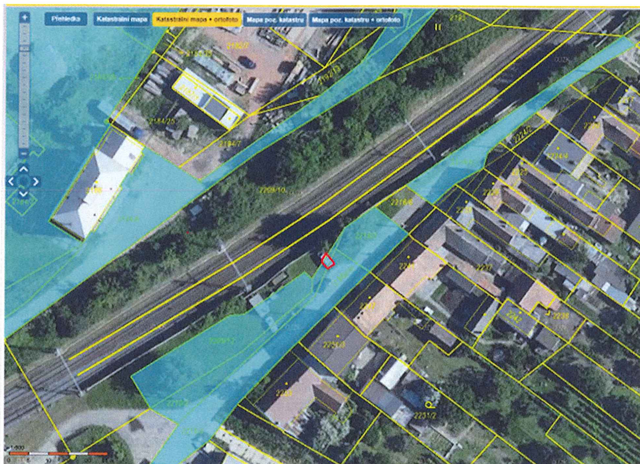
Příloha: Zákres částí pozemků p.č.2210/2 a 2216/3 určených k pronájmu