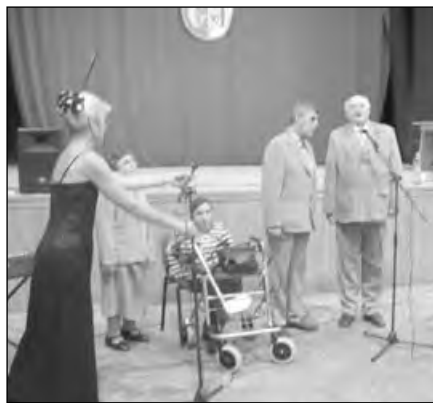
Zpěváci z Chrlic na Dni seniorů