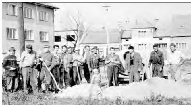
Dnešní park Na Rynku, dříve husí rynek. Na pamětním snímku brigádníci při budování chodníku.