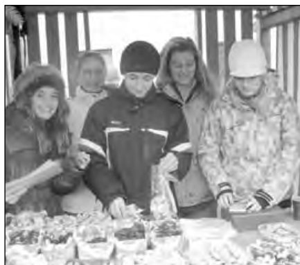
Mažoretky Neonky prodávaly vlastnoručně upečené vánoční cukroví a děti z Broučka zase krásné adventní věnečky.

Spokojené a klidné prožití vánočních svátků a pohodu po celý rok 2012 přeje redakční rada.